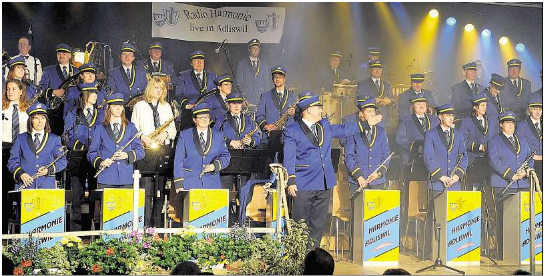
Auftritt in der neuen Uniform: Da machte das Musizieren am Galakonzert doppelt so viel Spass.

Adliswil Dreitägiges Musikfest ging rauschend über die Bühne – es fotografierte André Springer