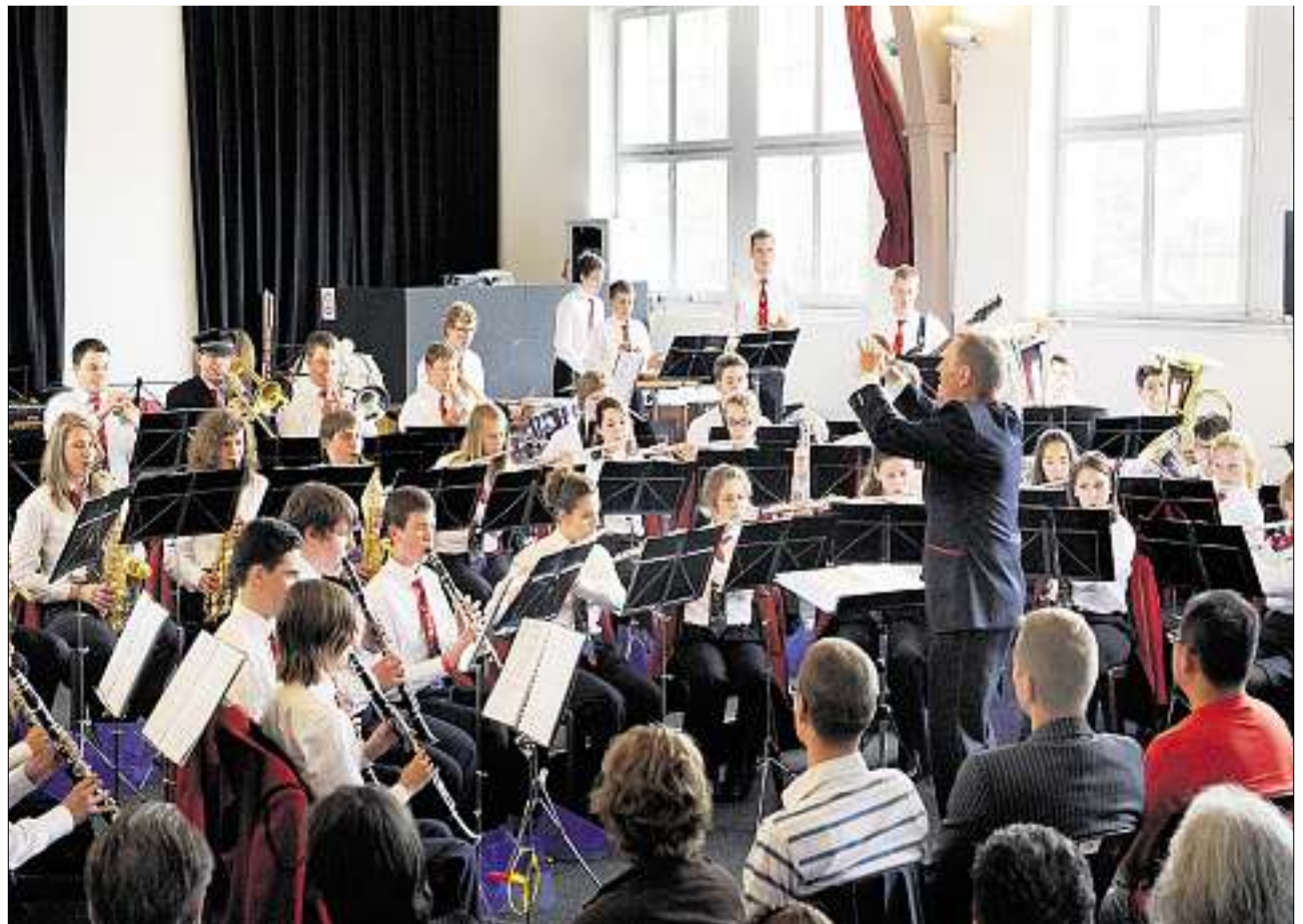
Kadettenmusik Horgen im übervollen Saal der Adliswiler Kulturschachtel.