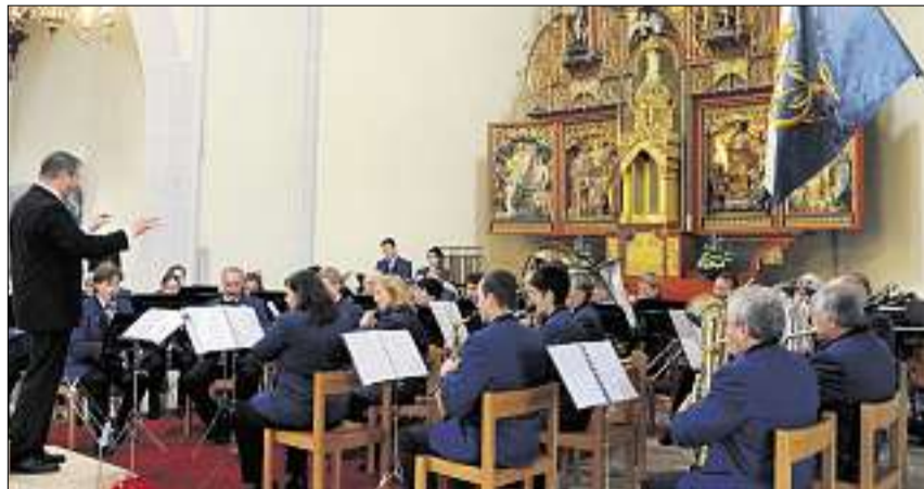
Musikgesellschaft Hirzel in der katholischen Kirche Adliswil.